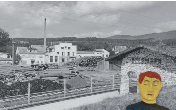
Fabrik mit eigener Bahnstation, Grafenwiesen um 1950 Továrna s vlastní železniční stanicí, kolem r. 1950