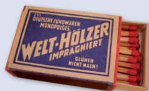
Die Zündholzsachtel des 20. Jahrhunderts: „Welthölzer“ Krabička na zápalky 20. století: „Welthölzer“