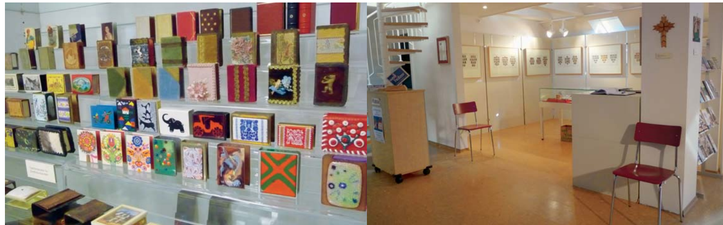
Schmuckbehälter für Zündholzsachteln / Ozdobný zásobník na krabičky od zápalek

Das Museum zeigt Teile der umfangreichen Spezialsammlung von Zündholz-Behältnissen für Wand, Tisch und Tasche in vielfältigen Formen und Materialien.