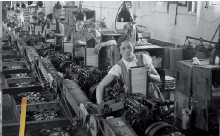
Frauen am Fließband, um 1940 | Ženy u výrobní linky, kolem r. 1940