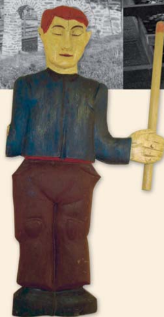
Zündholzmann, der einst den „Allemann“-Maibaum bekrönte, Schnitzarbeit, um 1940

Das Zündholz entwickelte sich im Laufe des 19. und 20. Jahrhunderts zum billigen Massenprodukt und unverzichtbaren Alltagsgegenstand. Im Bayerischen Wald entstand ein Schwerpunkt der Produktion.