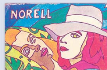
Aus aller Welt: Zündholzsachteln und Etiketten Z celého světa: krabičky a etikety na zápalky

Na ploše o velikosti zhruba 100 metrů čtverečních vykresluje muzeum zápalek vývoj od malovýroby k průmyslové výrobě a přibližuje historické vazby k sousedním Čechám.