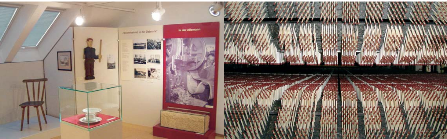
Einblicke in die lokale Geschichte / Pohled do místní historie