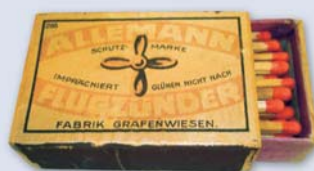
„Allemann“-Zündholzschachtel, um 1940 Krabíčka na zápalky, kolem r. 1940

Die Zündholzfabrik Allemann in Grafenwiesen wurde wichtigster industrieller Arbeitgeber der Region, sie bot in den 1950er Jahren rund 350 Menschen Arbeit, mußte 1986 aber schließen.